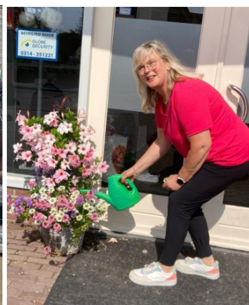
"Ik zet liever de bloemetjes buiten!"