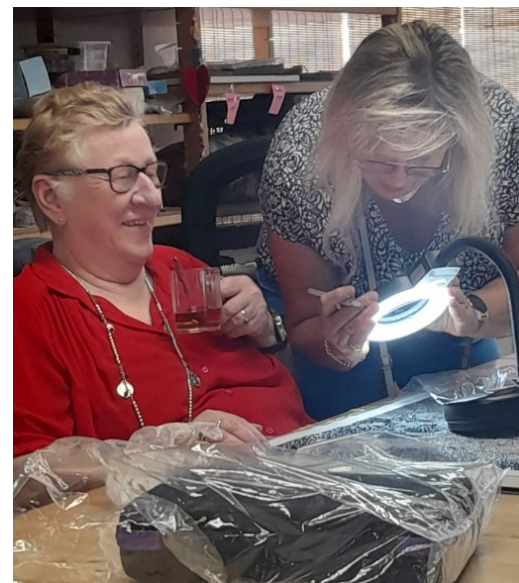
"Is dit diamond painting? Hoe werkt dat? Is toch niks voor mij dit. Hoe dan?!"