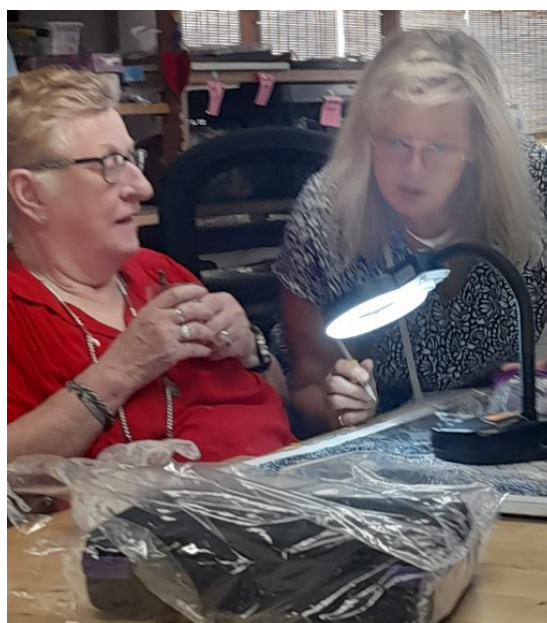
"Dit is niks voor mij als alleskunner"