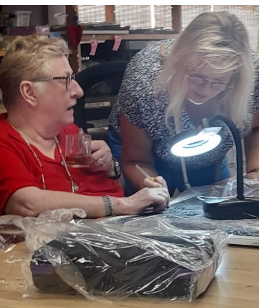
"Hoe plak je die steentjes dan? Moet je lijmen of moet ik op die pen drukken? Pff... Dit doet het niet."